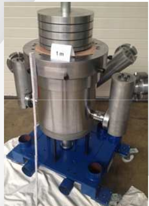
Neuer Blaskopf Ø30mm Düse Heizleistung 10-15 kWh Stahlgewicht 0,4to

Allein schon durch die Bauweise sind die so kurz gehalten, dass Umstellzeiten sowie der Abfall reduziert werden.